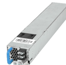
PM600-48/12 BTF 1