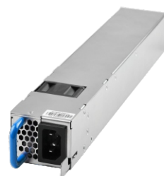
PM600-220/12 BTF 1